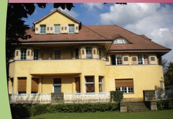
Wohngruppe für Kids

Paul Gerhardt Werk –Diakonische Dienste- gGmbH